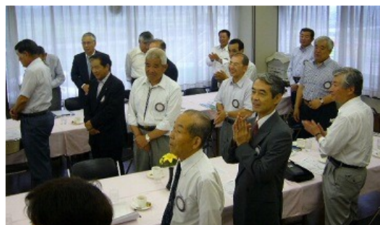
会員の皆さんからのお祝いの拍手