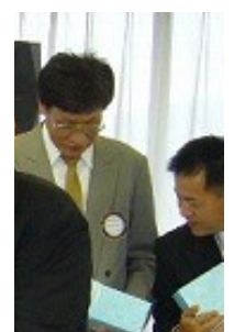
岩本会長からのお祝いメッセージを微笑みつつ...