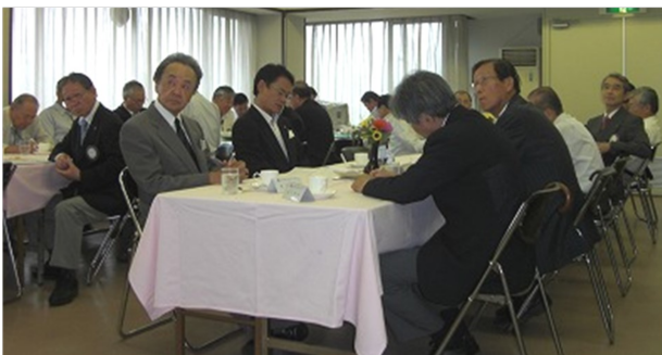
ご来席の枚方・交野両クラブの会長・幹事様