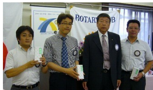
7月入会記念日の方々に会長より記念品が