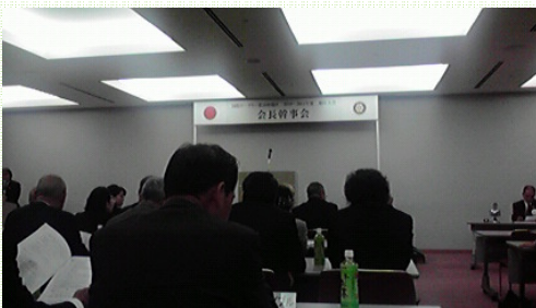
大会第1日目 分科会(会長・幹事会)

10月29日(金)~30日(土)地区大会開催されました。 於：大阪国際会議場・リーガロイヤルホテル