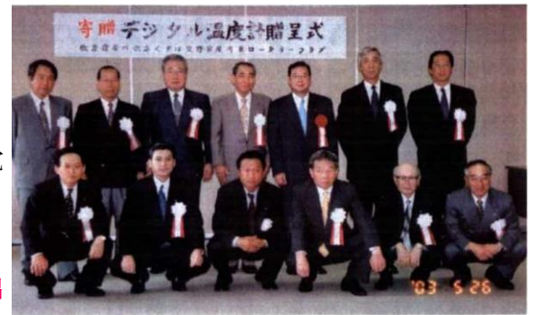
2003年6月 枚方市駅南口 デジタル温度計塔寄贈式

最後に 一言、入会させて頂いてから25年の長きにわたり大過なくすごし、さらにそれぞれのイベントに参加できたことについて感謝し、くずはロータリークラブが今後ますます発展充実することを祈念して筆を閉じます。