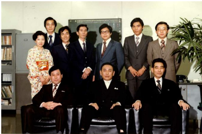
昭和55年大阪国税局主任税務分析専門官当時 (写真前列右が私)

しかし、19年夏ごろから戦争が激しくなり、16才になった兄に村役人並びに隣組長から「男ばかり4人の子どもがいるから長男を予科練に入るよう」と執拗に勧めてこられたが、祖母は、「この戦争にうちの孫は一人たりとも予科練には行かさない」とガンとして判をおさなかったことで、村中の評判になったようです。