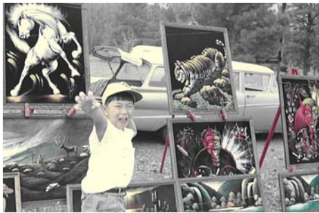
グランドキャニオン(アメリカ)にて (小学2年生の頃)

私は昭和38年4月に関西医大香里病院で産声を上げました。保育園の頃から悪がきで近所の家の垣根に火をつけたり、大晦日に石を投げて近所の家のガラスを割ったり、何度も母とご迷惑をおかけした家にお詫びに行き、本当に母には申し訳ない事ばかりさせた親不孝者でした。