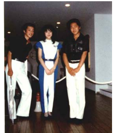
源本会員(左)と神戸ポートアイラ ンド博覧会にて (18歳の頃)

勉強嫌いで体育しか出来なかったの で、高校進学は浪商学園高等学校にい きましたが、運動神経が良いと思っていた 私がこの高校では普通の人！大阪のレ ベルの高さに驚きました。また当時、牛島