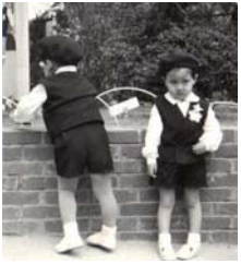
小さな「うみの星」園児