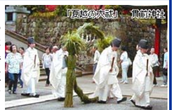
『夏越しの大祓』 貫前神社

『備後風土記逸文』に茅の輪を腰につけて厄をまぬがれたという神話があり、昔から茅（かや）は、その旺盛な生命力によって災厄を除く神秘的な威力を持つと考えられている。これに因んで我が国では、夏越しの大祓には茅の輪をくぐって厄を逃れる神事が連綿と受け継がれている。