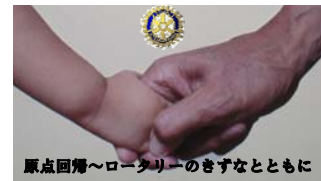
原点復帰～ロータリーのきずなとともに