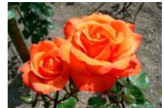
オレンジのバラ 花言葉:絆

最後に、例会に出席され「きずな」を深めていただくことをお願いし、皆様の御多幸を祈念し筆をとじます。