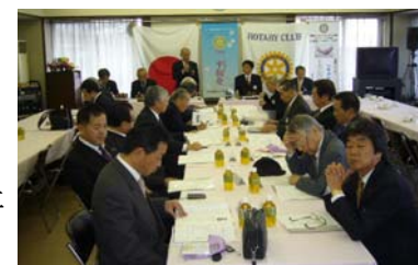
クラブ協議会の様子