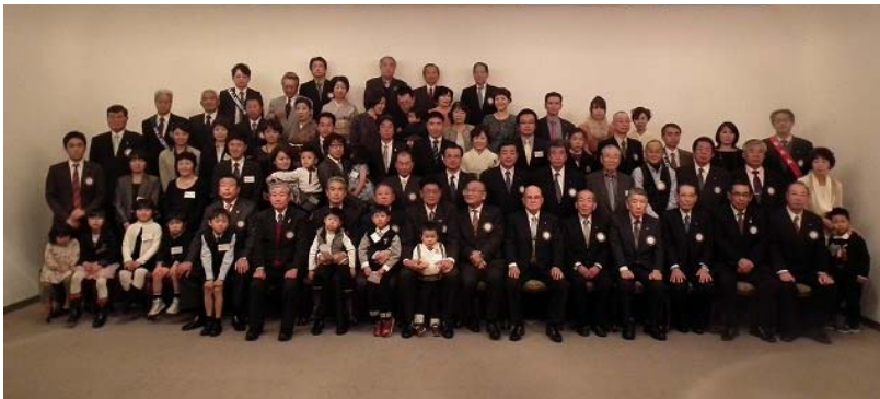
会員ならびにご家族一同集合写真