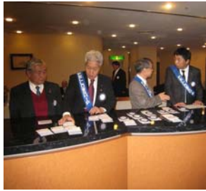
親睦委員による受付