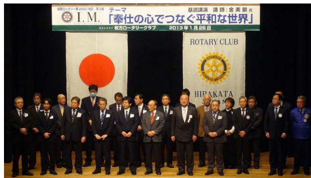
2012年2月～2013年1月に入会された新会員紹介