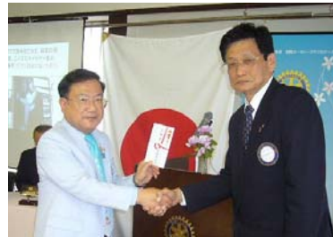
高島会長より今年度の支援金が授与されました

子供たちへ、地道ですが最も確かな識字率向上支援をしております。その活動に対し、毎々「くずはロータリークラブ」様から貴重な支援金を頂いております。心より感謝申し上げます。