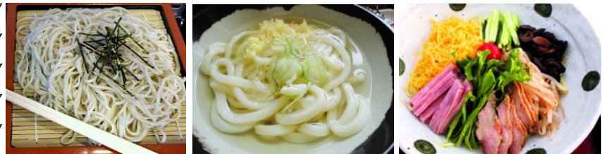
先週の例会100万ドルランチMはざるそばセット、ざるうどんセット、冷麺でした！

2013-2014年度が始まり3回目の例会となりました。 本年度は、皆様にご案内通り100万$ランチを12回予定しております。その内容におきましては会員の皆様から不平・不満がでないよう、飽きる事のないようランチメニューに趣向を凝らしました。 先週、本年度初の100万$ランチMが会員の皆様に披露され大変好評を頂きました。残すところ11回の100万$となっておりますが、次回はランチC、その次はランチDとそれぞれを順番に出していきますので、何が出るか楽しみにお待ちください。季節によって、C, D, Mの内容が変わりますので併せてお楽しみに！！