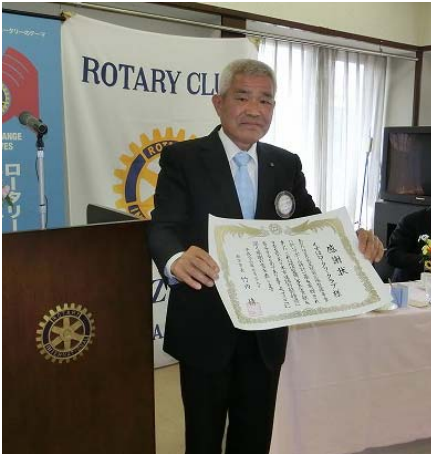
JR長尾駅前広場時計台寄贈にあたり 枚方市より感謝状を頂きました (2014.3.29長尾駅前広場の完成式にて)