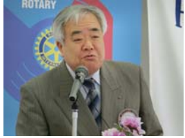
地区災害支援プロジェクト初木委員