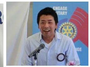
社会奉仕 稲田委員長