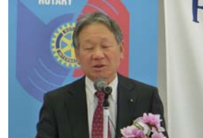
原田会長エレクト

○各奉仕部門・CLP委員長より本年度の事業報告、地区出向委員より地区活動報告、会長エレクトより次年度事業等についての発表がありました。