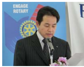
国際奉仕 日野幹事