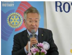
クラブ奉仕 小北副会長