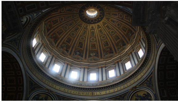
バチカン宮殿内部写真