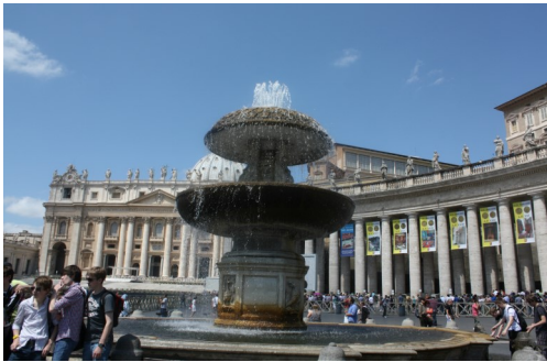
バチカン宮殿外観写真

バチカン市国のサンピエトロ大聖堂の隣にあり、ローマ法王の住まいとなっている。バチカン市国は、世界最小の国で、現在フランシスコ法王が統治している。軍隊を持たず、傭兵はスイス人がしている。カトリックの総本山とされ、世界中の人が訪れる大聖堂の一つだ。