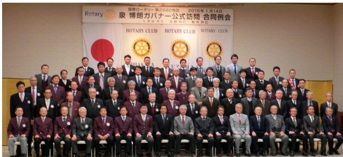
泉博朗ガバナー公式訪問記念写真