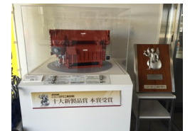
高効率ナチュラル チラー「エフィシオ」が 2013年日刊工業新聞 十大新製品賞を受賞