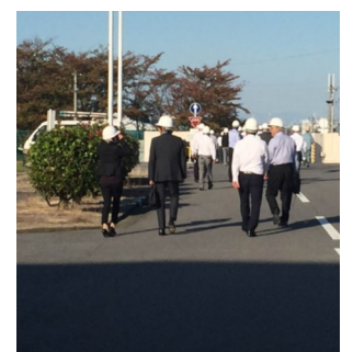
公私ご多用にもかかわらず、多数の会員皆様にご参加を頂きありがとうございました。