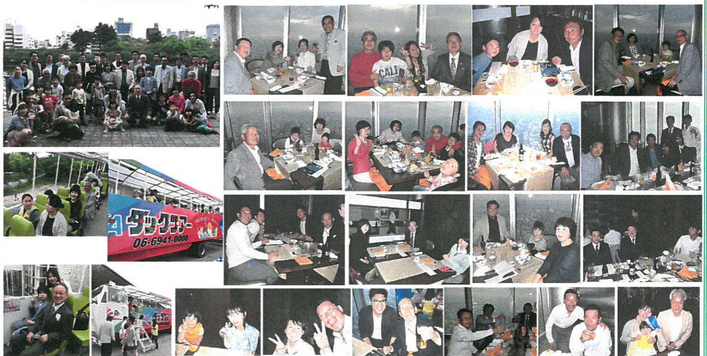
参加会員29名 参加ご家族31名 事務局1名 合計61名