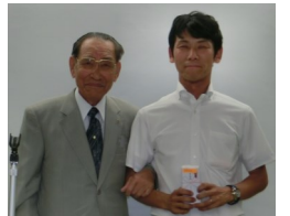
6月誕生日の藤原会員と一緒に