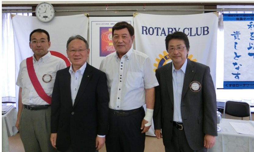
役員の皆様 一年間お疲れ様でした ありがとうございます