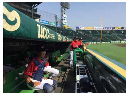
第32回全国ロータリークラブ野球大会 於:甲子園球場 対戦相手:愛知豊田西RC