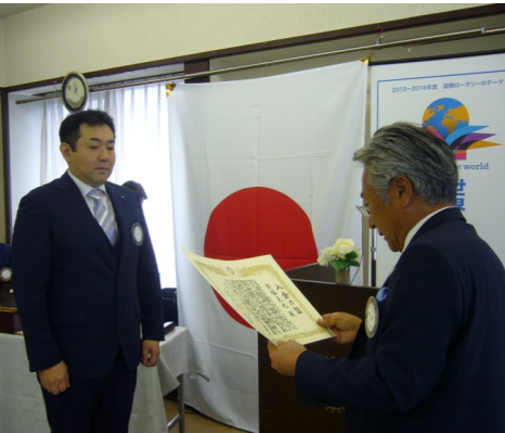
安福克也新会員に小北会長より入会の証・徽章の授与