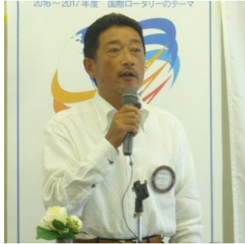
源本 将人 会員