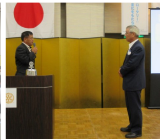
國田副会長より謝辞