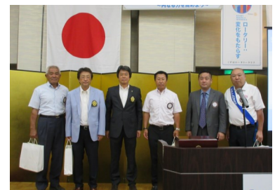
(左から)北川会員、岡山会員、山口会長 米田会員、山本会員、田中商人会員