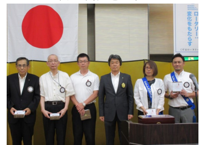
(左から)山中会員、三木会員、今平会員 山口会長、田代会員、川上会員