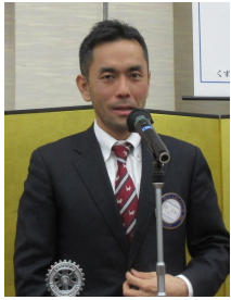
原正和財団委員長