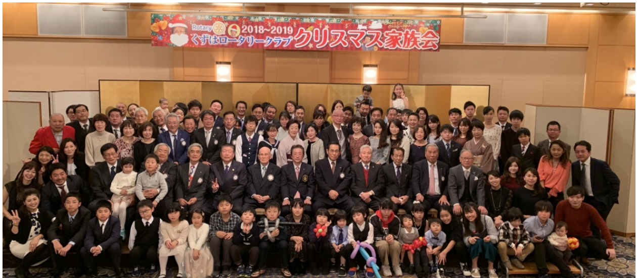
今年のクリスマス家族例会は「ものまねアラジン」のスターの方々と一緒に大いに盛り上がりました