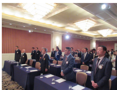
国歌・ロータリーソング 斉唱