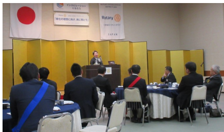
今話題の日本伝統芸能「講談」神田先生の迫力ある話芸は圧巻でした