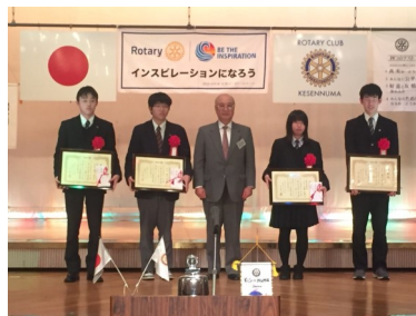
18-19年度奨学金受賞者4名