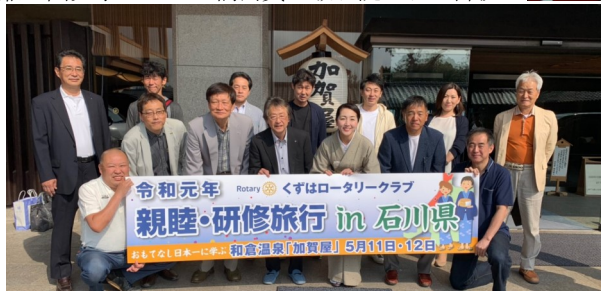
世界一のおもてなし宿・加賀屋若女将と一緒に集合写真