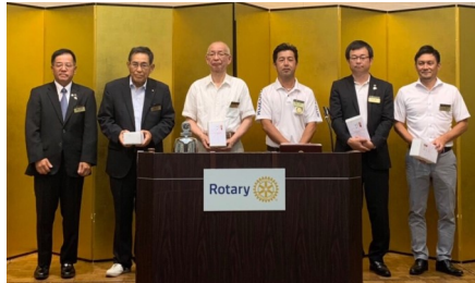
國田会長 山中会員 三木会員 柏本会員 今平会員 川上会員