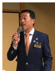
源本実行委員長補佐