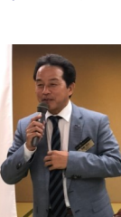
日野副実行委員長