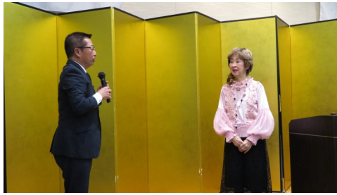
米田副会長より謝辞