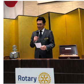
「お客様紹介」川上会員