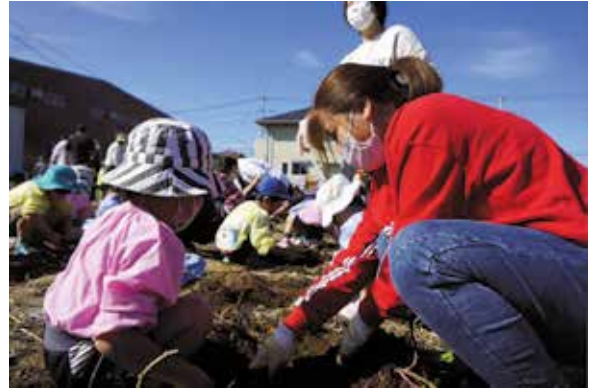
子どもたちをサポートする奨学生