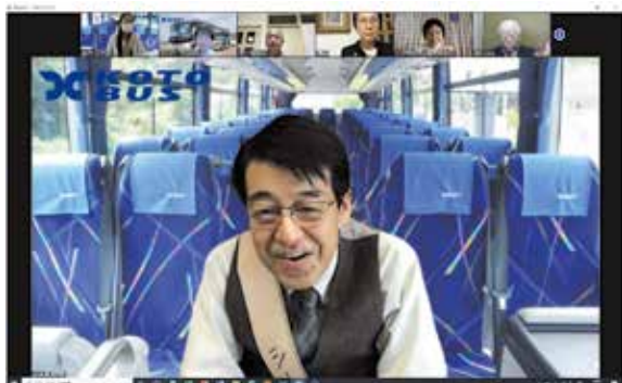
バスの車内さながらのバーチャルツアー(宮崎地区米山奨学委員長)

ツアーを終えた奨学生からは、「歴史教育は国によって異なるが、母国を離れて日本にいる私が歴史を正しく認識・理解し、友好関係を築くための懸け橋になることが重要だと感じた」、「帰国したら日本語教師として中国の子どもたちに自分が感じた真の日本を伝え、海の向こうに世界平和に向けて努力している方々が大勢いることを伝えたい」といった声が寄せられました。