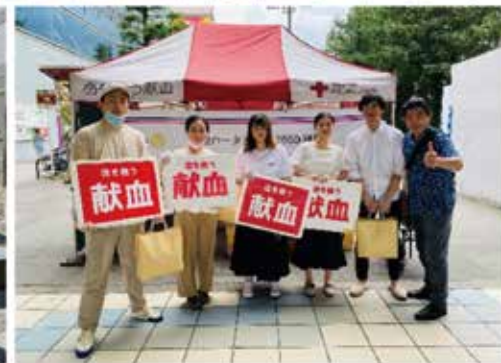
国際ロータリー第2660地区 / RAC地区献血へ米山奨学生・学友の参加