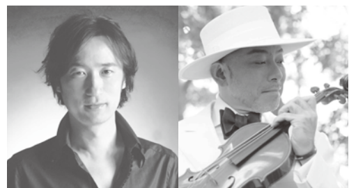
雅楽とヴァイオリン、究極のハーモニー 映像と音楽による感動のフィナーレ