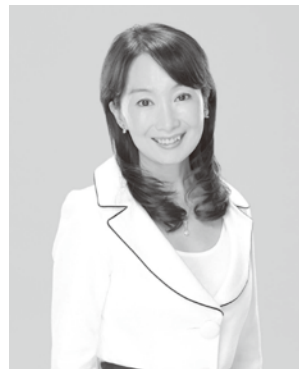
アグネスチャン氏