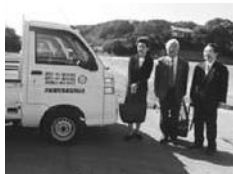
大船渡漁協前にて