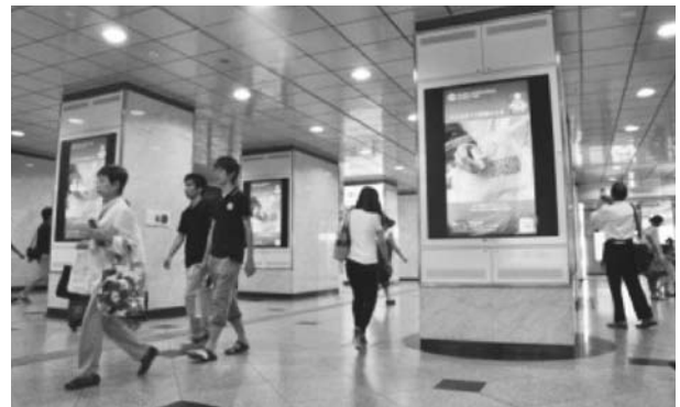
JR大阪駅電光掲示板

2008~2009年度から、ラジオ大阪(放送対象地域・近畿広域圏)において「あなたのそばにロータリー」(年間10回、10分程度)を放送。DGE、AG、地区代表幹事、地区委員長などが出演することが習わしになっている。特に8地域のAGは、輩出地域に密着したロータリーの話題を提供している。昨年度は、初めて放送を聴いたリスナーから地区宛に「ポリオ撲滅のために」と寄付金が届いたという嬉しい出来事もあった。