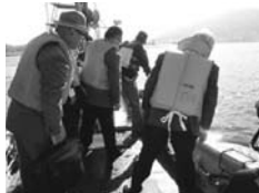
カキ養殖場を視察