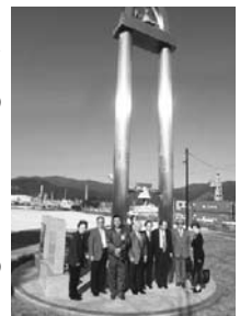
鎮魂愛の鐘前にて (大船渡市)