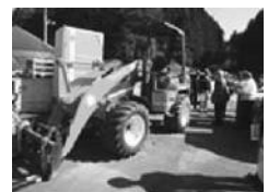
寄贈された重機 (石巻市)