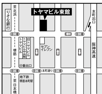
※地下鉄堺筋線 堺筋本町 ⑫番出口すぐ

土曜、日曜、祝日 年末年始 2015年12月29日(火)~ 2016年1月4日(月)