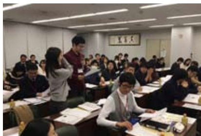
メインプログラム中の様子