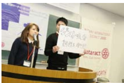
マニフェスト発表の様子

最後に今回この行事を準備して下さいました大阪御堂筋本町ローターアクトクラブの皆様、提唱ロータリークラブの大阪御堂筋本町ロータリークラブの皆様、そして様々なご指導頂きました地区ローターアクト委員会のご協力に感謝申し上げます、「地区連絡協議会」のご報告とさせていただきます。